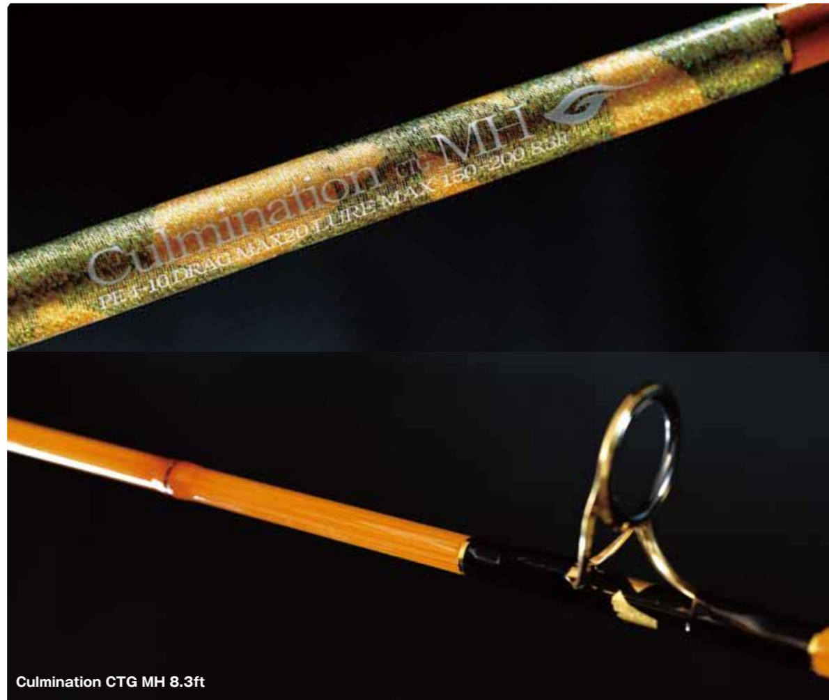
Culmination CTG MH 8.3ft