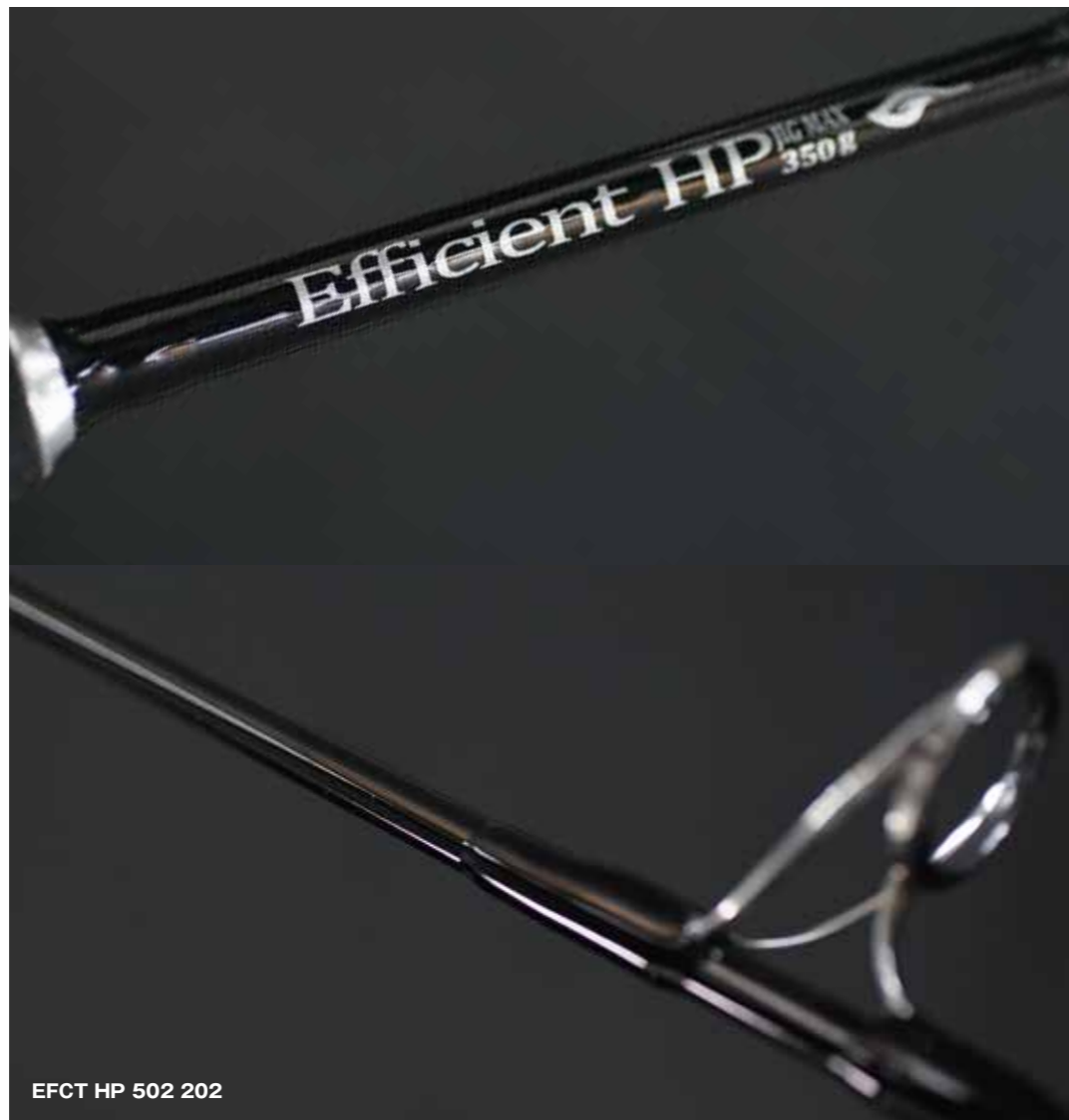
EFCT HP 502 202