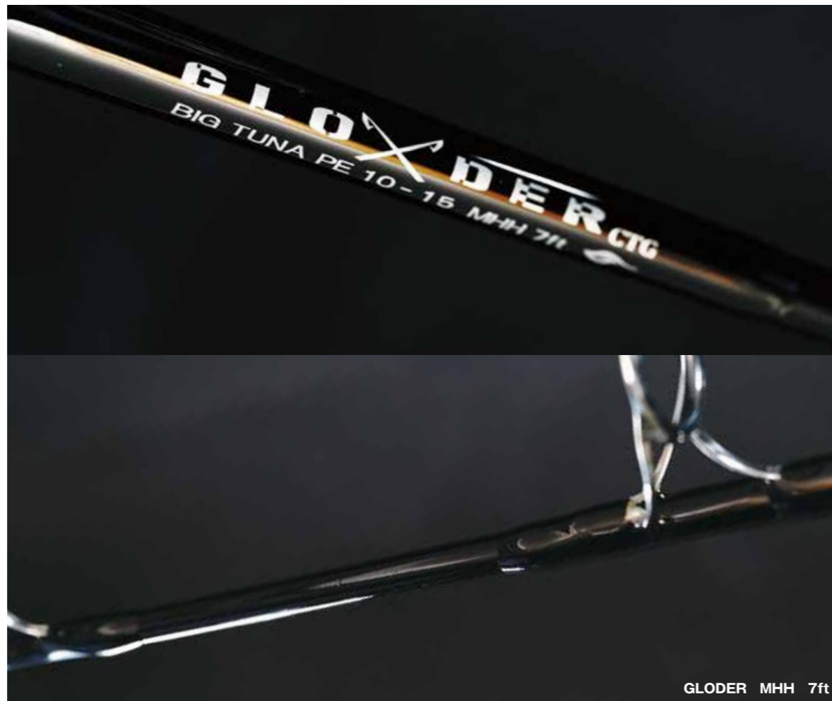
GLODER MHH 7ft